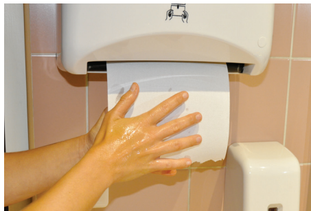
5. Sécher ses mains avec une serviette ou un séchoir automatique