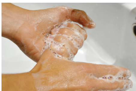
5. À la base des pouces