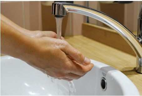
1. Mouiller ses mains