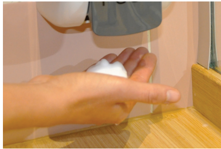
2. Utiliser du savon liquide