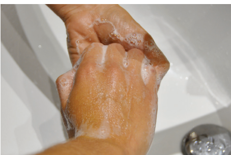
4. Au niveau des ongles