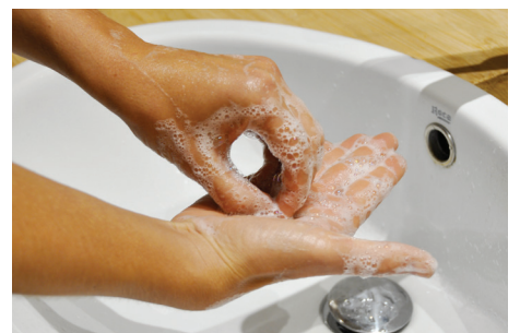
6. Au niveau de la pulpe des doigts