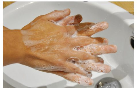
3. Les doigts entrelacés