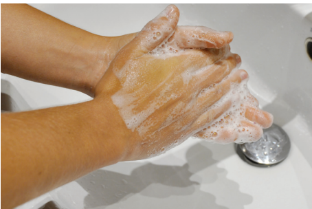
1. Paume contre paume