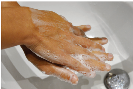
2. Le dessus et la paume des mains en alternant les positions des mains l'une sur l'autre