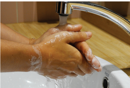
4. Rincer ses mains