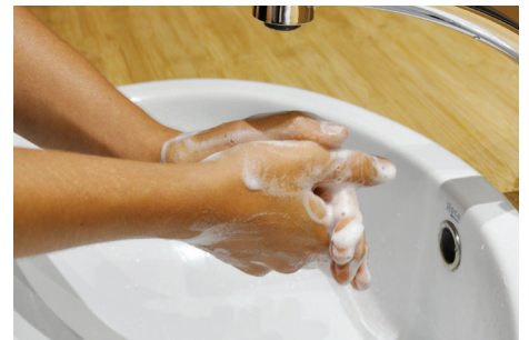
3. Compter jusqu'à 15 tout en savonnant et en frottant ses mains