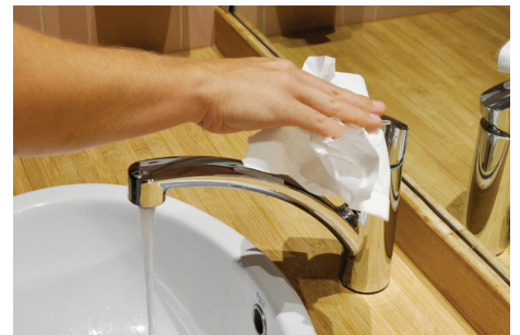
6. Fermer le robinet avec une serviette ou le bout de sa manche